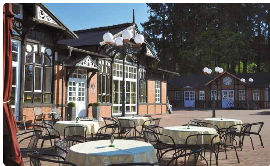
Pohled na novou klubovnu.