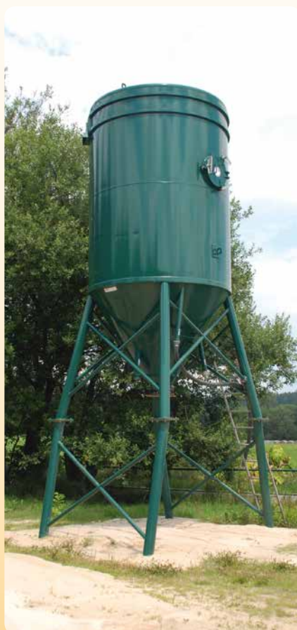
„Silo“ na 22 tun, pro přípravu suchého kvalitního písku pro stroj „Drill and Fill“.

Nyní musíme prodat některé starší stroje. Většina vozů u nás má odpracováno více než 2 000 hodin. Ale správně by se měly prodávat stroje už po 1 500 hodinách práce. Některé naše stroje