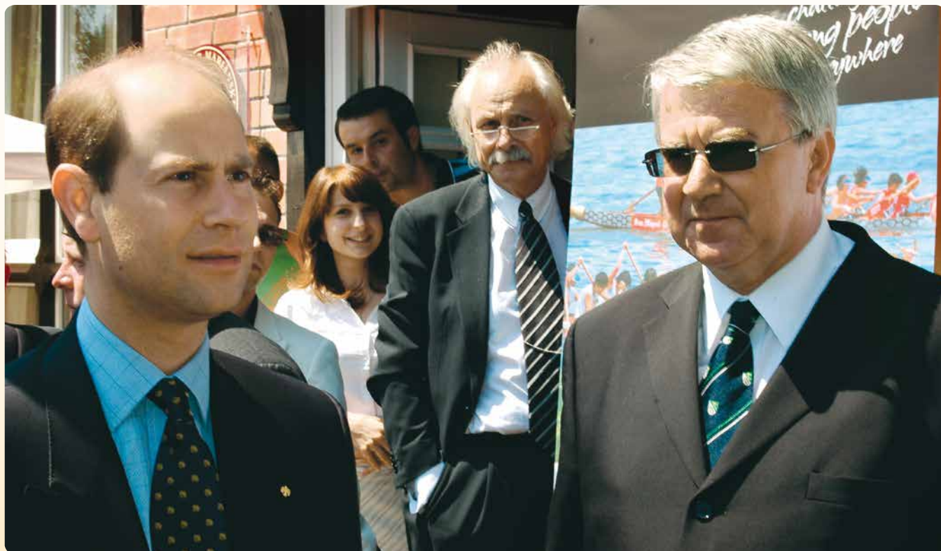
Princ Edward v RGCM – Rok 2005.

Mariánské Lázně mají obrovskou ubytovací kapacitu a je tady hodně golfových hotelů. Klasickými golfovými hotely jsou Park Hotel Golf, Esplanade, Hotel Morris. S Rezidencí Golf máme úžasně vztahy. S hotelem