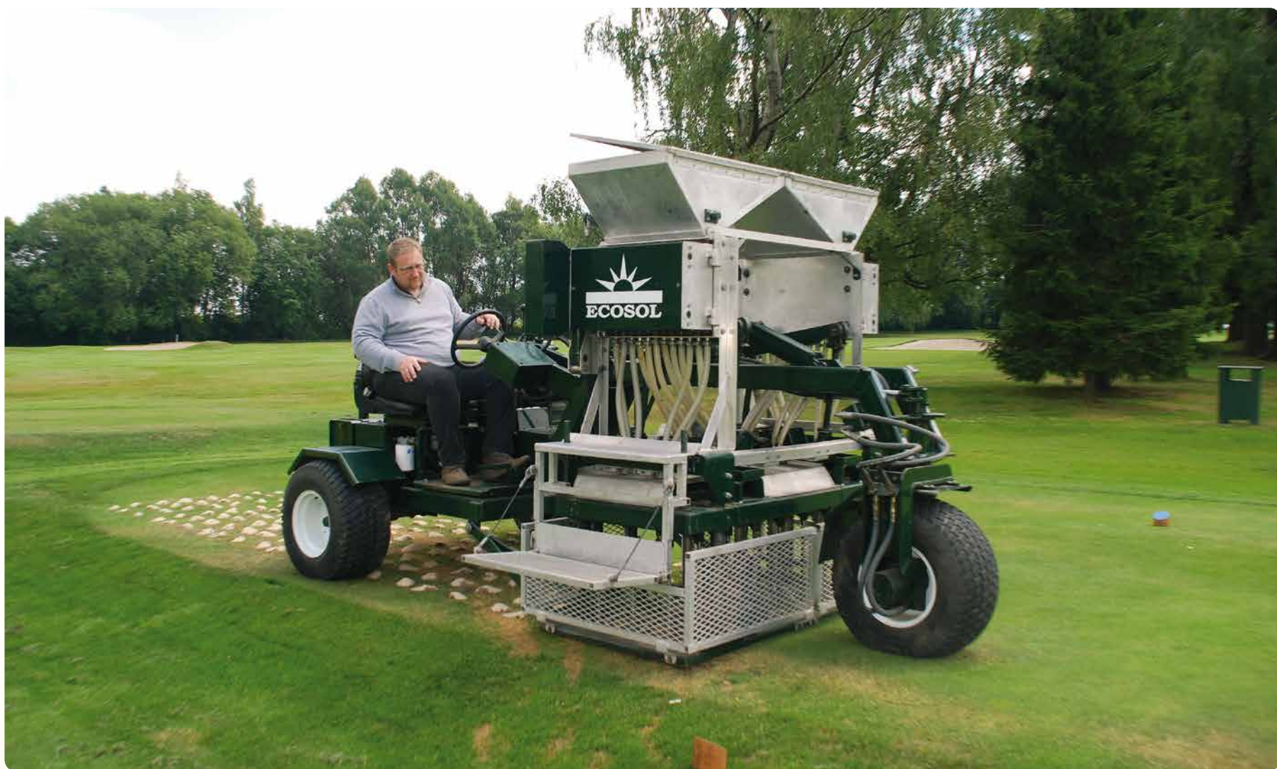
Tak vypadá nový stroj „Drill and fill“.

Odhalím tajemství: není žádný rozdíl, všichni hráči jsou stejní! Někteří vždy opravují pitchmark