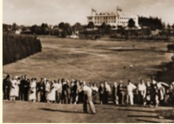
Henry Cotton, Czechoslovak Open, 1935