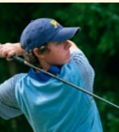
Rory McIlroy, St Andrews Trophy, 2006

Zveme návštěvníky do renovované historické klubovny s restaurací, barem, letní terasou, komfortními šatnami a zázemím. Poskytujeme caddy hall, driving range s 36 odpališti, 2 přihrávkové a 2 patovací jamkoviště, 9-jamkové PAR 3 hřiště, zimní tréninkovou halu s odpališti a full-screen simulátorem, profesionální golfovou školu, plně vybavený Pro shop. Kompletní výbavu a vozíky možno vypůjčit. Úzce spolupracujeme s pěti mistrovskými hřišti v dosahu 50 min. jízdy.